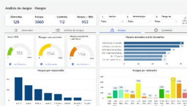
RISIKOANALYSE – DASHBOARD