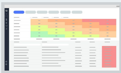
MAPA DE CALOR