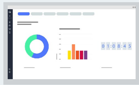
PROGRAMA DE PRUEBAS