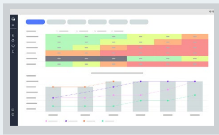
BIA (BUSINESS IMPACT ANALYSIS)