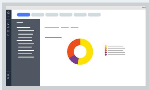
STATISTIQUES PAR ENTREPRISE