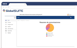
Estadísticas por empresa