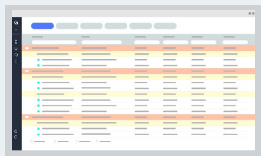
SoA (STATEMENT OF APPLICABILITY)