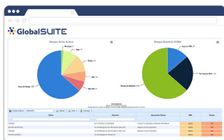
◀ Gestión de riesgos