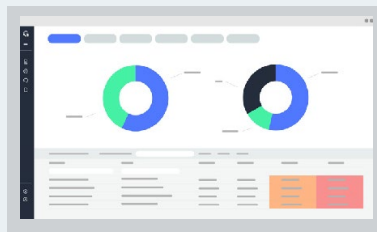
EJECUCIÓN DE AUDITORÍAS